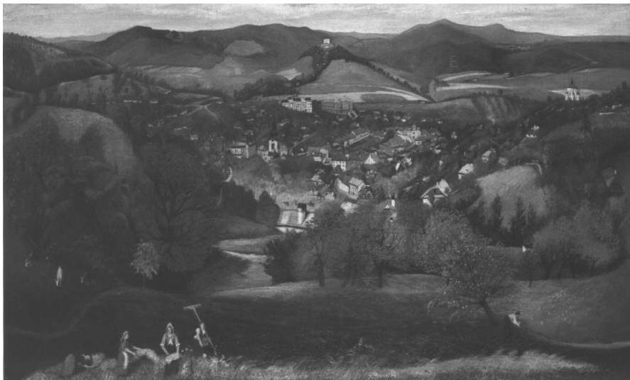
Csontvári Kosztka Tivadar: Selmecebánya látképe

„Selmec az Istened, anyád, szeretőd, menyasszonyod, testvéred, mindened, aki bántja, ellenséged!”